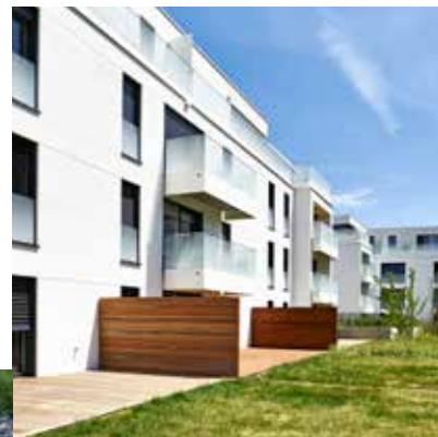
Andara à Cessange

Ci-contre, quelques quartiers neufs commercialisés par Carré Immo.