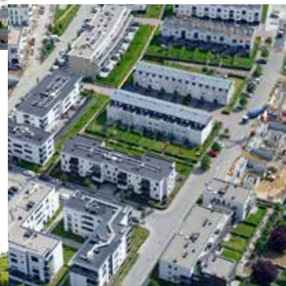
Domaine Floréa à Schiffange