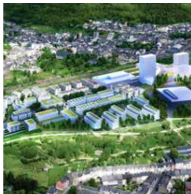
Arboria à Differdange