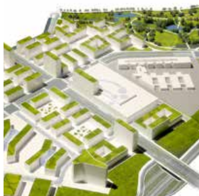
La Cloche d'Or au Ban de Gasperich